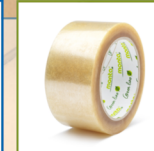
monta reTec 831